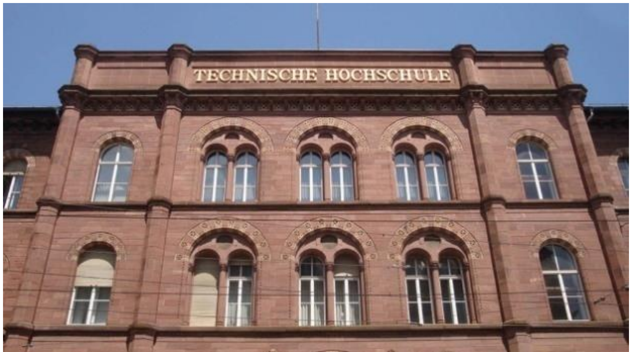
Technische Hochschule Karlsruhe.

In Deutschland kannst du an Universitäten, Fachhochschulen sowie Kunst-, Film- und Musikhochschulen studieren. Welcher Typ der richtige für dich ist, hängt unter anderem davon ab, was du studieren willst. Es gibt außerdem eine Unterscheidung in staatliche und private Hochschulen. Die Qualität ist an allen vergleichbar gut.