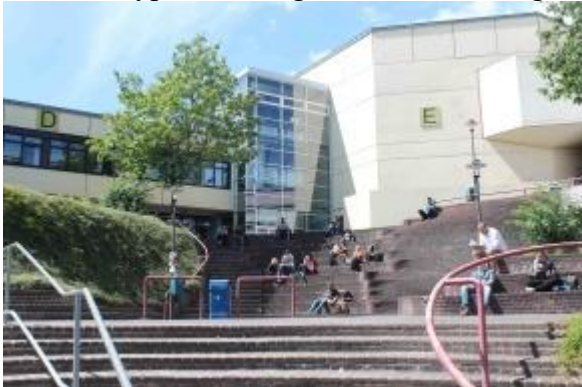
Universität Siegen.

Welcher Typ der richtige für dich ist, hängt unter anderem davon ab, was du studieren willst.