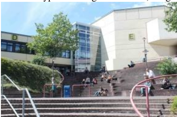
Universität Siegen.

Welcher Typ der richtige für dich ist, hängt unter anderem davon ab, was du studieren willst.