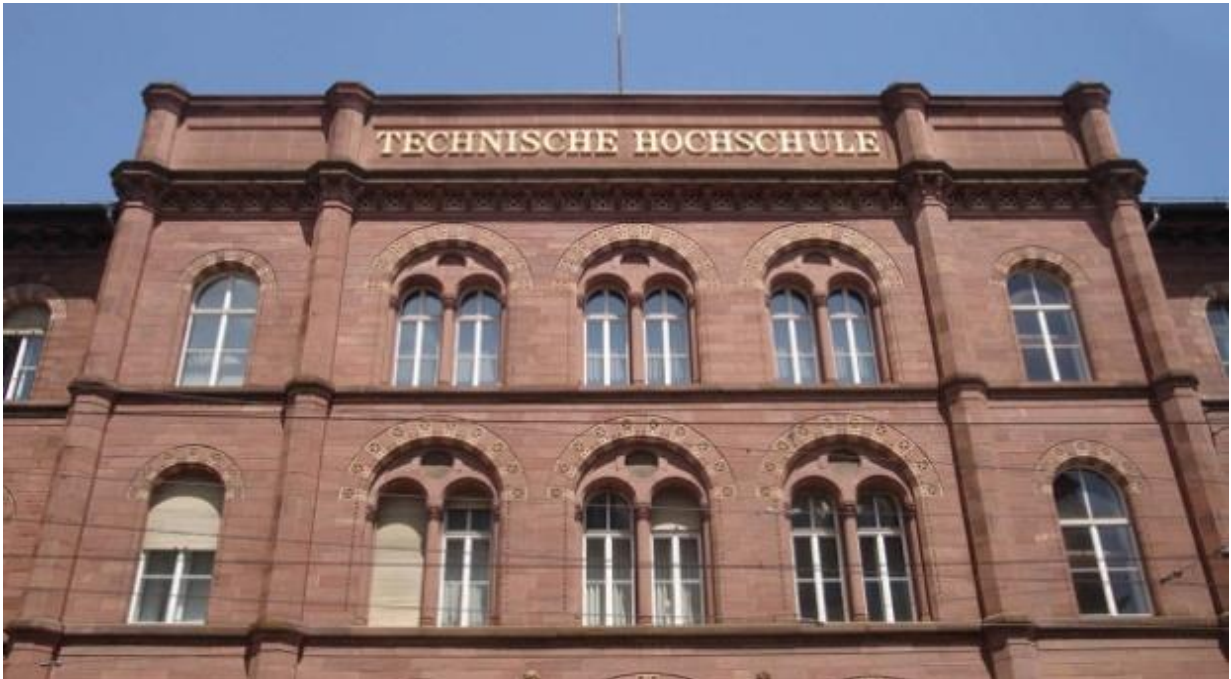
Technische Hochschule Karlsruhe.

In Deutschland kannst du an Universitäten, Fachhochschulen sowie Kunst-, Film- und Musikhochschulen studieren. Welcher Typ der richtige für dich ist, hängt unter anderem davon ab, was du studieren willst. Es gibt außerdem eine Unterscheidung in staatliche und private Hochschulen. Die Qualität ist an allen vergleichbar gut.