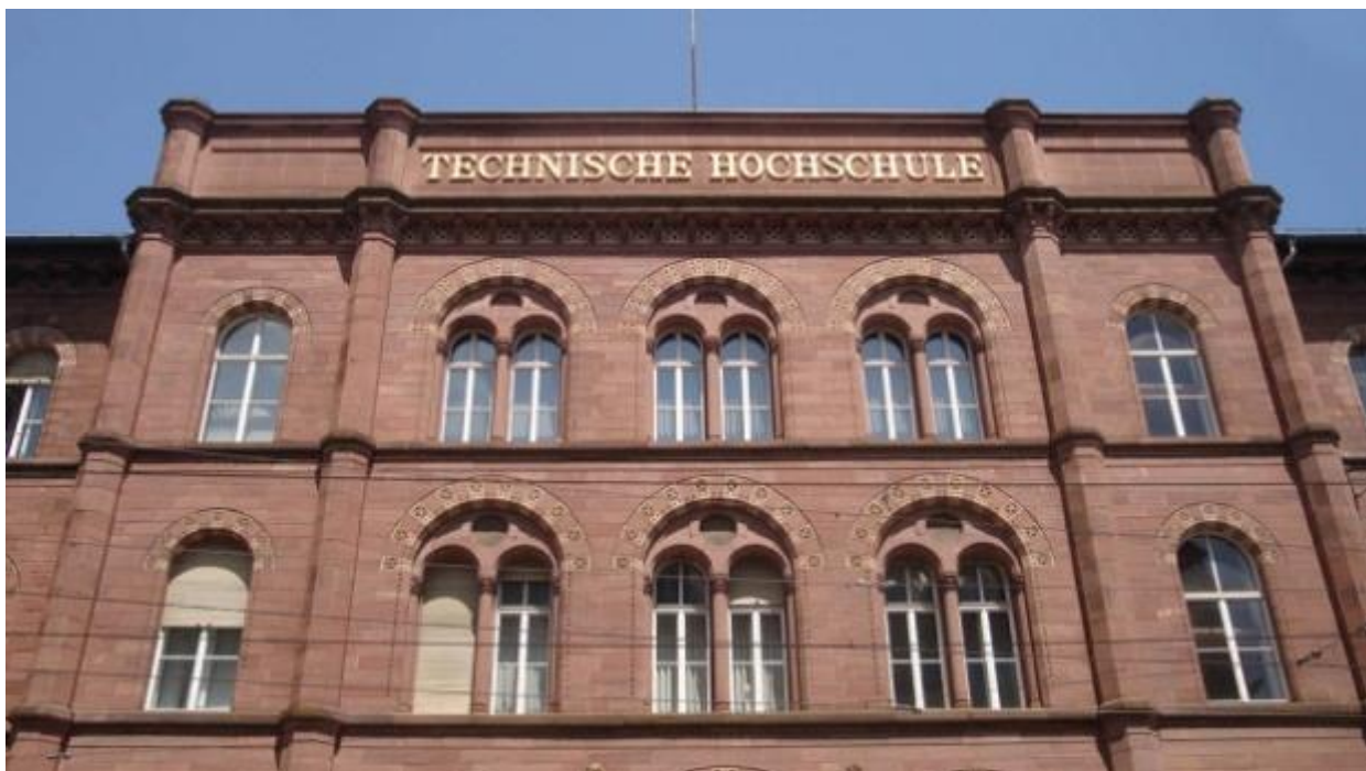
Technische Hochschule Karlsruhe.

In Deutschland kannst du an Universitäten, Fachhochschulen sowie Kunst-, Film- und Musikhochschulen studieren. Welcher Typ der richtige für dich ist, hängt unter anderem davon ab, was du studieren willst. Es gibt außerdem eine Unterscheidung in staatliche und private Hochschulen. Die Qualität ist an allen vergleichbar gut.